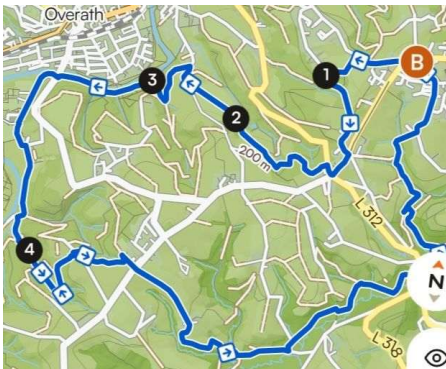
M3 – Aggertal u. Naafbachtal – 14,30 km