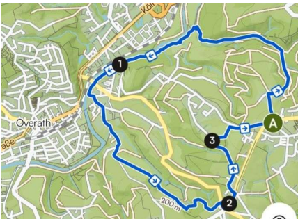
M1 – Die Aggerschleife – 8,20 km

Die Streckenlängen sind wie folgt aufgeteilt: