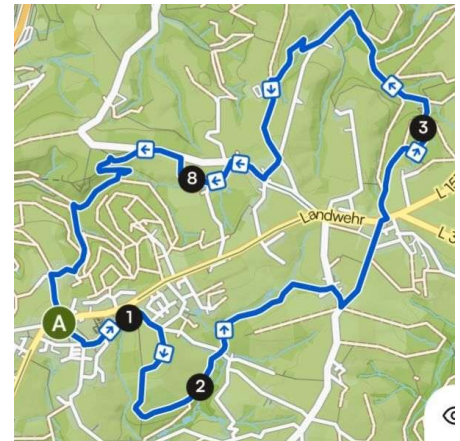
M2 – Drei Täler Runde – 11,20 km