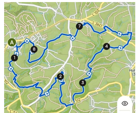
M4 – Die Naafbachrunde – 16,30 km

Bei besten Wetterbedingungen (nicht zu kalt/warm, trocken) haben wir uns wie immer in den letzten Jahren wandernd der 50 KM angenommen und sind neben 80 anderen Gleichgesinnten um 07 Uhr gestartet. Für alle der vorgenannten Angebote fanden sich insgesamt 359 Interessierte. Für die große Runde galt ein Zeitrahmen von max. 13 Stunden, den wir auch problemlos, wenngleich aufgrund körperlicher Einschränkungen deutlich langsamer als in den Vorjahren, einhalten konnten.