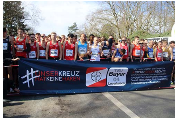
Vor dem Start des ersten Meisterschaftsrennen zeigte der TSV-Bayer 04 ein Zeichen und die Unterstützung der Kampagne #SportgegenRechts