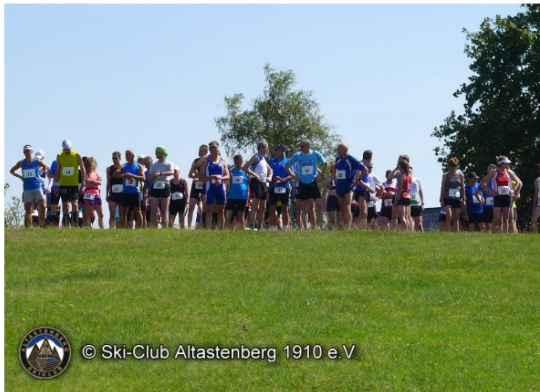
Volkslauf am 19.07.2014 in Altastenberg

Aufgrund meiner Genügsamkeit war ich mit weniger durchaus zufrieden und widmete mich der 11 km-Strecke. Auch dieser Kurs durch Hollands alpine Region hatte es in sich, denn steht man oben auf dem Starthang (Foto) und schaut steil nach unten, dann ahnt man, was das