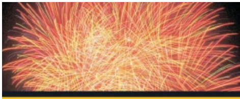
Silvesterlauf Bonn 2012

Im Rahmen des Deutsche Post Marathon Bonn