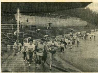
Bei strömendem Regen wurden die Läufer im Stadion Lochweise auf die Strecke geschickt.