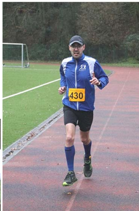
im Stadion kann man noch etwas wett machen oder auch einbüßen.