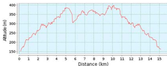
Höhenprofil (152 m bis 398 m)

Das Wetter war schwach bis schlecht, die Strecke ist schwer bis beschwerlich, Aufzeitläufer können mit ca. Angaben nix anfangen, schwachen LäuferInnen wird der Unterschied zu Trainierten in Form von Zeitabständen und rasantem Überholen über eine Stunde