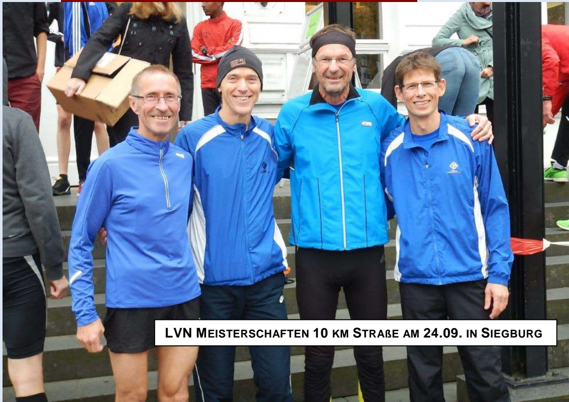
LVN MEISTERSCHAFTEN 10 KM STRAÙE AM 24.09. IN SIEGBURG