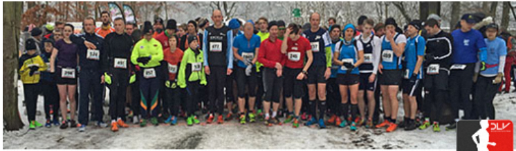
33. Winterlaufserie in Köln-Porz: 22.01.2017 - 05.02.2017 - 19.02.2017