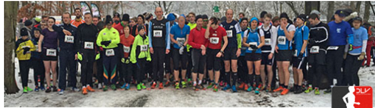
33. Winterlaufserie in Köln-Porz: 22.01.2017 - 05.02.2017 - 19.02.2017